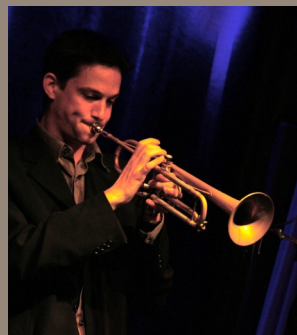
TROMPETTE et CUIVRES