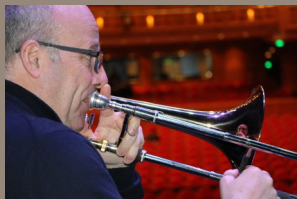
TROMBONE et CUIVRES