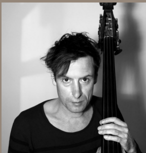
BASSE ET CONTREBASSE